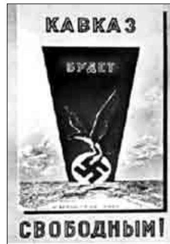
Пропагандистский плакат «равноправных союзников» Гитлера