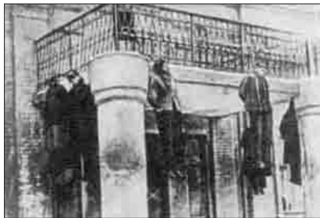
Лозунг "Смерть жидам, москалям и ляхам" в действии. 30 июня 1941г. после захвата немцами Львова, при помощи украинских националистов была уничтожена вся еврейская профессура из местного университета и все те, кто сотрудничал с советской властью. Оуновцы делали это сами, не доверяя немцам. Знали кто есть кто.

Следует отметить, что такие настроения относились не только к военному периоду, но и практически ко всей российско-советско-украинской истории. В официальных украинских учебниках второй половины 90-х гг. Россия все чаще стала выступать в роли агрессивного соседа, навязывающего свой строй и образ жизни. А Украина приобрела на страницах учебников образ колонии-жертвы. Украинская советско-партийная система была расценена как колониальная администрация, обслуживавшая интересы оккупационного режима и московских верхов. Широкое хождение полу-