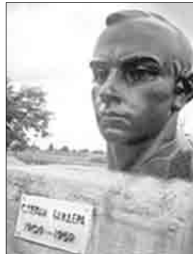
Памятник Степану Бандере, установленный в музее-усадьбе его семьи в селе Воля-Задержавцкая

С середины 1990-х гг. в украинской историографии стал развиваться синдром жертвенности. ореол мученичества, подвижничества, избыточность жертв, неизмеримость материальных потерь, утраты, понесенные как от «своих», так и от «чужих» - такие образы и сюжеты стали лейтмотивом описаний Украины военных лет. Это коснулось не только военной эпохи, а было распространено фактически на всю украинскую историю. «Успешные последствия битвы за Украину не принесли долгожданного умиротворения ее народу. Это только казалось, что война вышла за пределы Украины. На самом деле она не оставила эту многострадальную землю», - так звучит одна из заключительных фраз в «Истории Украины» в разделе «Вторая мировая