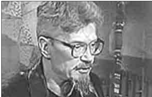
Эдуард Лимонов - частый гость RTVi