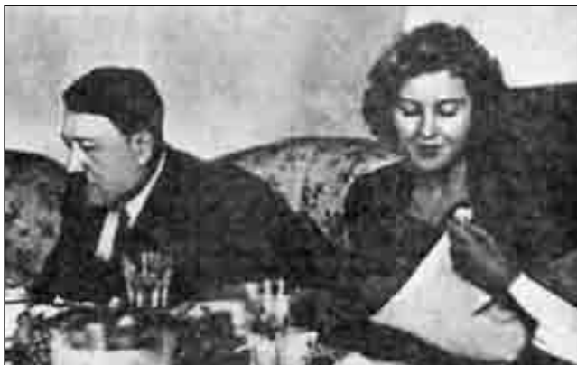
Адольф Гитлер и Ева Браун

Помню, что при первом сеансе радиоперехвата я узнал о смерти одного из лучших президентов Америки - Франклина Делано Рузвельта. Рейхсминистр пропаганды Геббельс заговорил об ожидаемом расколе между странами - участниками антигитлеровской коалиции, о возможном в ближайшее время военном столкновении Красной армии с войсками Америки и Великобритании. В одном из следующих сеансов я услышал сразу два сенсационных сообщения. Первое было о том,