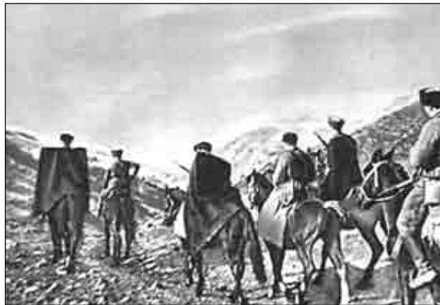
Дезертиры уходили в горы и вливались в ряды антисоветского подполья

Официальные советские источники военного времени однозначно свидетельствуют о массовом характере антисоветского движения на Северном Кавказе. Согласно поступавшим в Москву донесениям, после нападения гитлеровцев на Советский Союз в регионе наблюдалось массовое уклонение от призыва в армию. Так, в Чечено-Ингушетии при первой мобилизации в