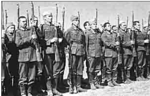
«Кавказские орлы третьего рейха»

тизм в Кабардино-Балкарии, свыше 200 оказались бывшими коммунистами и комсомольцами.