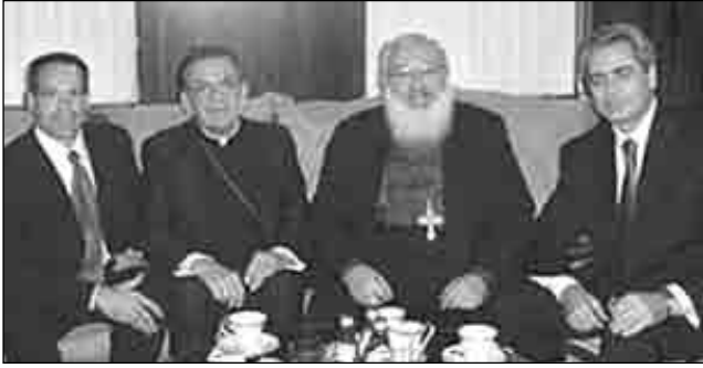
На снимке: встреча представителей украинской диаспоры, «правозащитников» и американского дипломатического корпуса с патриархом украинской греко-католической церкви