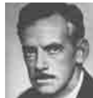
Юджин О' Нил

Юджин О' Нил Постановка – Янош Шаш Художник-оформитель – Риккардо Хермандец Костюмы – Эдит Шюц Художник по свету – Кристофер Акерли