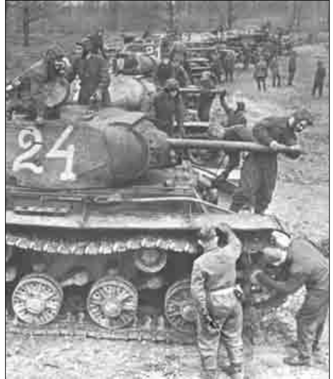
Перед броском на Берлин

Через пять-шесть километров показались сначала сторожевые вышки, затем длинный деревянный барак за колючей, в несколько рядов, проволокой. Ни грузовика, ни эсесовцев мы не увидели, старик, видно, что-