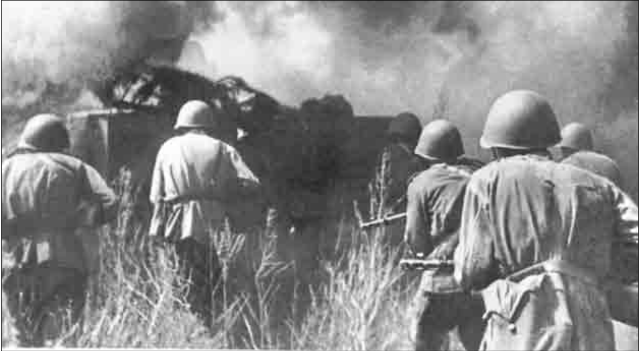
Пехотно-танковая атака советских войск

Прошу сообщить обо мне в американскую военную миссию в Москве». Как мы потом узнали, всем американским летчикам выдали такие платки на случай, если придется сделать вынужденную посадку на территории, уже занятой советскими войсками.