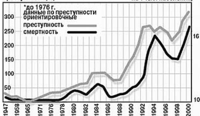
Динамика преступности и смертности в России Прирост преступности (%)* Смертность (число умерших на 1 тыс. населения)

Попробую суммировать причины снижения рождаемости. Во-первых, это аборты. Если каждый зачатый ребенок у нас в стране родился бы, то проблема вымирания не стояла. Вторая причина – это стрессы от смены общественной формации, которые переживает народ. К вымиранию народа приводят пьянство, отравления, наркомания, туберкулез, автокатастрофы, убийства и самоубийства, гибель военнослужащих и сотрудников правоохранительных органов в локальных войнах на территории России. Сюда можно добавить еще разводы. Потому что их следствием является прекращение рождаемости.