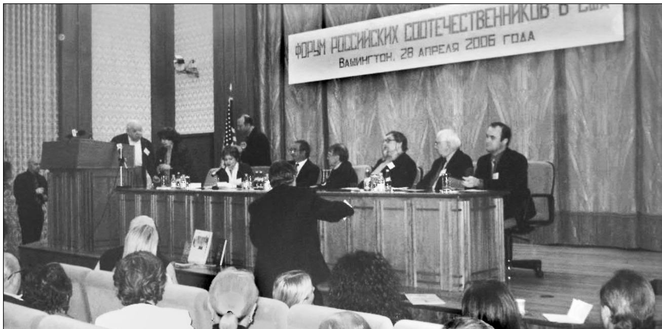
Форум российских соотечественников в российском посольстве в Вашингтоне.

«Все это звучит невинно и «правозащитно», - настаивает Аллистер Монк, - но эксперты в области безопасности и геополитики рассматривают такое единство, основанное на «общей русской культуре, ценностях и ментальности», как очень мощное политическое оружие российских властей. Будучи привязано финансово и, главное, политически к России, единство соотечественников будет продвигать интересы Москвы все более и более... В соответствии с различными данными, 15-20 миллионов русских живут за границей более чем в 30 странах. Около четырех миллионов русских живут в Америке, столько же в Западной Европе...» Назвав эти убийственные цифры, Аллистер Монк не может удержаться, чтобы не заметить, какую идеальную почву для распространения шпионажа (по версии Монка, в пользу Кремля, хотя почему бы не наоборот?) создает «нашествие русских» с их многочисленными, щедро оплачиваемыми (?) объединениями.