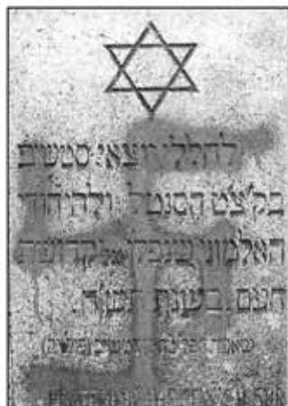
Танцшманцы-обжаманцы радикалов.

Украинская национальная ассамблея — Украинская народная самооборона (УНА-УНСО) 29 февраля предложила ультраправым организациям Испании, Германии, Франции, Белоруссии и Чехии создать Международную конфедерацию националистических сил.