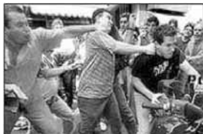
Время мирных демонстраций прошло. Фото: "Скрытая камера-2000"

Вчера по стране прокатилась волна разграбления магазинов. Власти были вынуждены ввести на всей территории Аргентины чрезвычайное положение. После объявления президентом Фернандо де ла Руа о введении ЧП, десятки тысяч людей вышли на балконы и на улицу и стали бить металлическими предметами по касторкам.