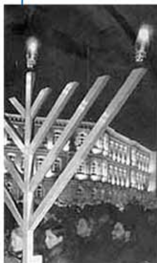
Так праздновали Хануку в Дюссельдорфе